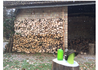
Unser Werk am Sonntag

draußen regiert der Frost. Es fällt Schnee und taucht Burow in winterliche Stille, unterbrochen nur durch gelegentliche Vogelrufe. Drinnen prasselt ein gemütliches Holzfeuer. Wir trinken Tee, lesen die dicke Zeitung, die uns Nachbarn freundlicherweise geschenkt haben und lassen den Geist schweifen.