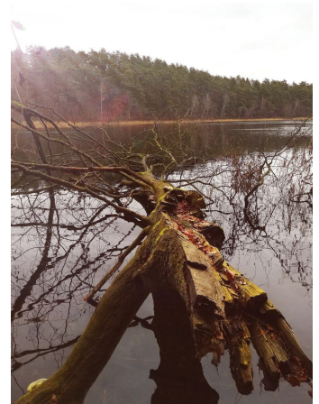
Spaziergang am Roofensee